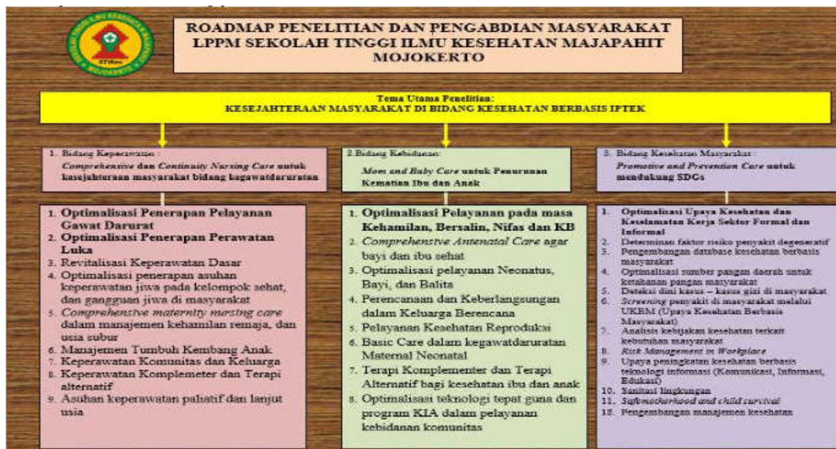
Gambar 1 Roadmap Penelitian STIKES Majapahit

Pengembangan Roadmap penelitian ini dilakukan dalam rangka memberikan arahan kebijakan penelitian sehingga mampu menghasilkan produk penelitian yang bermanfaat bagi kesejahteraan masyarakat di bidang kesehatan berbasis IPTEK, sehingga memiliki nilai komparatif dan kompetitif dengan penelitian unggulan lain yang sejenis.