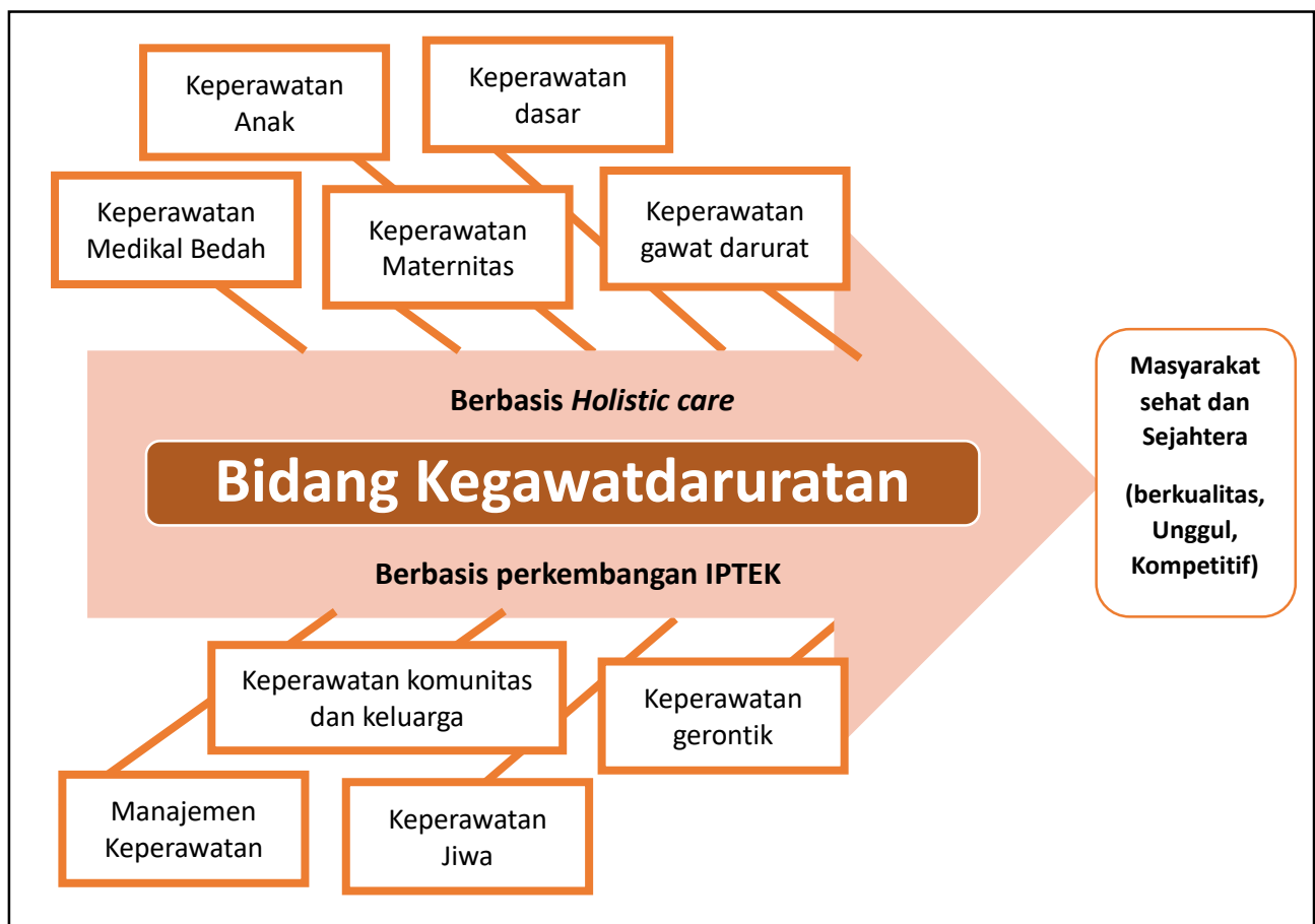
Gambar 1. Roadmap Penelitian Prodi Pendidikan Ners STIKES Majapahit Mojokerto Tahun 2023-2028

Roadmap penelitian prodi mengacu pada visi keilmuan program studi yang ditetapkan dalam renstra prodi, sehingga dapat menjadi pedoman dosen dalam melakukan kegiatan penelitian.