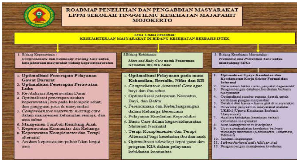
Gambar 1 Roadmap Pengabdian Masyarakat STIKES Majapahit

Pengembangan Roadmap pengabdian masyarakat ini dilakukan dalam rangka memberikan arahan kebijakan pengabdian masyarakat sehingga mampu menghasilkan produk pengabdian masyarakat yang bermanfaat bagi kesejahteraan masyarakat di bidang kesehatan berbasis IPTEK, sehingga memiliki nilai komparatif dan kompetitif dengan penelitian unggulan lain yang sejenis.